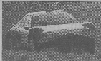
Favy/Fauconnet ne ménagent pas leur mécanique.

pions de France en 1998 et vice-champions de France en 2001, 2003 et 2007.